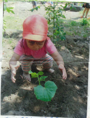
「手で触れてみる？」と問いかけると両手を使って葉に触れる。