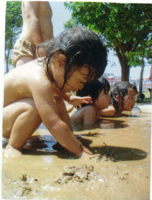
手で泥の固さを触れあわす。「エイエイ」と言う。