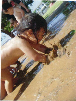
「わあ〜」と歓声を上げてうたふた寝をしてみる。