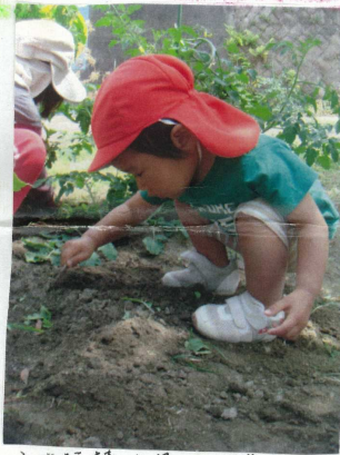
小さな棒を見つけてきて土いじりをする。