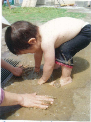
「トトロして気持ち良いよ」と声を掛けると「バシャバシャ」と言い手で泥水の感触を味わう