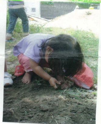
「だんだん虫がいるよ」と問いかけると「うん」と笑い探す。