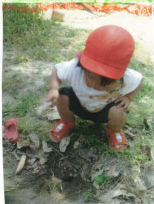
棒で落ち葉をはらいのけ「わあ」と土が出てきた事に喜ぶ「土が見えたね。」と言う