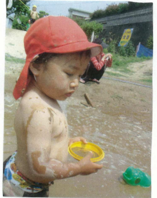
器に泥水を入れる「あれ何かよ」と言うと「コヒ(コヒ)と伝えてくれる。