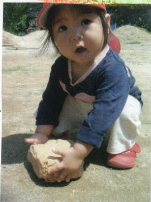
石を見つけかけよる「あ〜わあ〜」と叫んでいた「おもいね。」と言うとくはずし