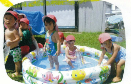
「お水、冷たい？」と言うと「つめたい」と喋る。「気持ち良いかな？」と言うと「うん」と喜ぶ