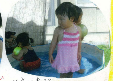
「えーい。お水だよ」と言うつめたいつめたい」と言い喜ぶ