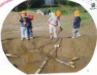
枝や木のつるで 魚釣り

トトロ池に 柳のつるや 木の小枝をたらし くっついた物を釣りに上げて 魚釣りごっこを楽しんでいる