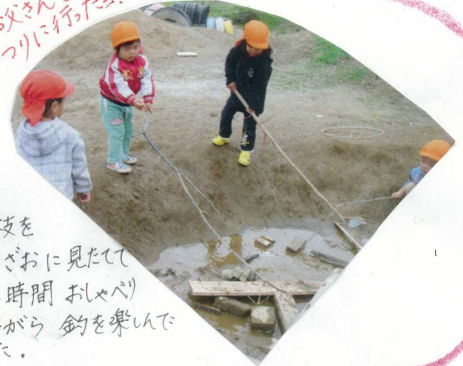
お父さんと つりに行こう!

小枝を 釣りごっこに見たて 長い時間 おしゃべり しながら 釣を楽しんで いた。