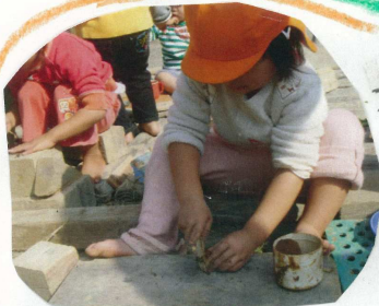
木ぎれで 素枝を切る