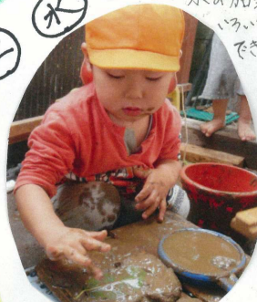
水の加減で いろいろな団子がい できた。