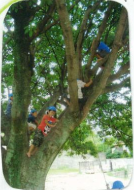
・高い所へと競うように登っていた